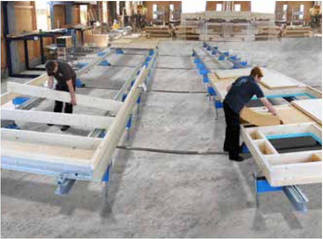
Vollflächige Elementierung, Bauer Holzbau | Tectofix